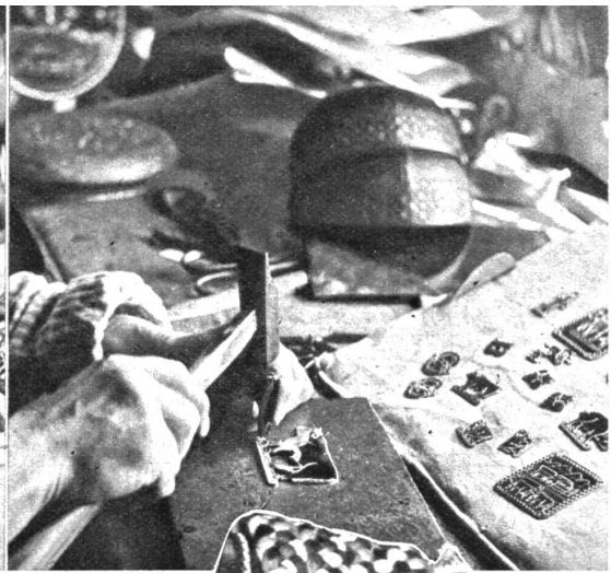
Oben links: Das Aussägen der auf der grossen Messingplatte angezeichneten Stücke zu Kühen, Sennen, Rosen und anderem. Oben rechts: Die ausgesägten Figuren werden nachgestanzt, ausgefeilt und poliert. Rechts: Alles Handarbeit: der Messingbeschlag der farbigen Pergamentsstepperei und die farbenfrohen Fransen und Zöpfe