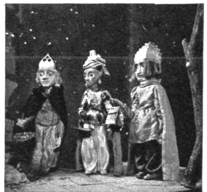
«Wir sind die heiligen drei weisen Mann, Wollen gern das Kindlein beten an.»