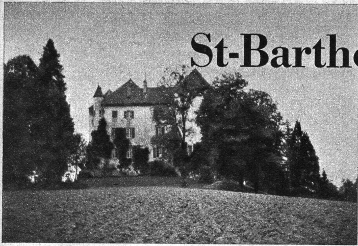
St-Barthélemy. Nordfront, die einzige Seite, die nicht von Bäumen umstellt ist

Eine gute halbe Stunde westlich von Echallens im Gros de Vaud, auf der höchsten von Wald umgebenen Erhöhung, weit in die Lande ausschauend, thront die alte Ritterburg St-Barthélemy. Die ehemalige Herrschaft Goumoëns, mit der das Schloss zusammengehörte, war in Verbindung mit der Abtei Romainmôtier gegründet worden und gehört noch heute zu den historischen Sehenswürdigkeiten der Waadt — obschon die meisten