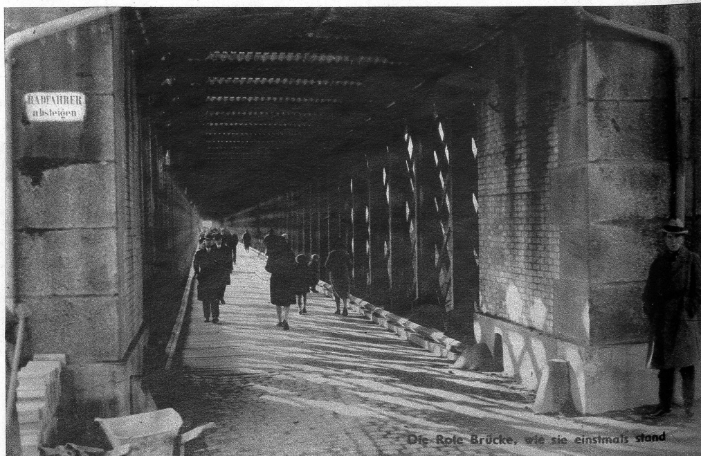
Die Rote Brücke, wie sie einstmal stand