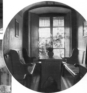
Traute Winkel im Schloss