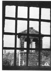
Blick vom obersten Stockwerk des grossen Turmes auf den zierlichen Glockenturm