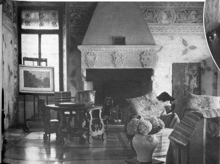
Links: In diesem Raum sassen früher finstere Söldner, heute schwingen hier Akkorde klassischer Musik