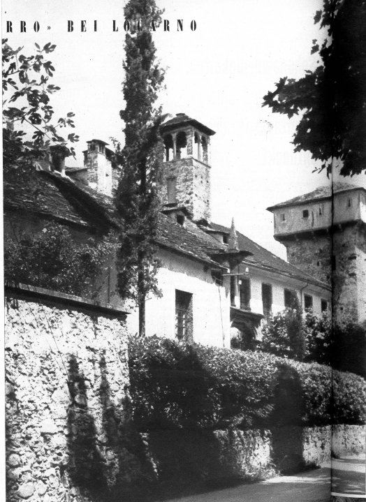
Unweit Locarno steht am See, halb versteckt, ein grosses Haus mit zierlichem Glockenturm über einem schweren Dach mit unzähligen Kaminen, mit einem mächtigen Wehrturm und vielen grossen und kleinen vergitterten Fenstern; die «casa di ferro» — das eiserne Haus

auch das Wappen derer von Roll aus Uri, der Keller und Fieser aus Luzern, sowie anderer Herren, die wohl als Basalte der «italienischen Vogtesen» kurze oder längere Zeit im Haus wohnten.