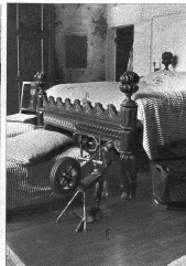
Seit Jahrhunderten steht dieses Bett hier