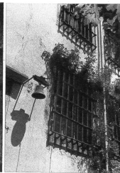
Die schweren Eisengitter sperren heute nicht mehr Söldner ein, sie stützen und halten rankende Zweige und Blüten