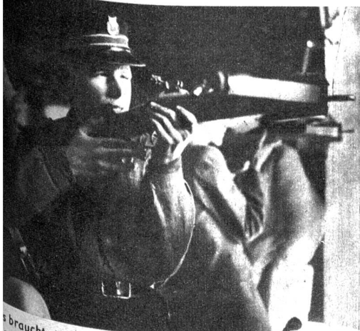
Das braucht ziemlich grosse Uebung, um mit der Armbrust das Herz Gesslers auf 50 m Distanz zu treffen. Deshalb muss mit aller Vorsicht gezielt werden