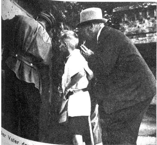
Der Vater des jungen Schützen ist gespannt, was sein Sprössling geleistet hat