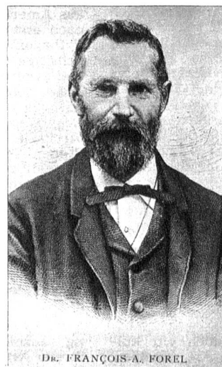
F. A. Forel 1841—1912

Er ist der Erfinder des nach ihm benannten Augenspiegels . Dank minutiöser Untersuchungsmethoden gelang es Haab, zahlreiche neue Krankheitsbilder des Auges festzustellen. So sind vor allem zu erwähnen seine Entdeckungen über die Veränderung des gelben Flecks im Alter und nach Verletzungen. Schon 1885 entdeckte er den nach ihm benannten Hirnrindenreflex der Pupille. Von grosser Bedeutung für die Unfallchirurgie des Auges war die Einführung des Riesenmagneten, der die schonende Entfernung sehr kleiner Metallsplitter aus der hintersten Zone der Linse ermöglicht.