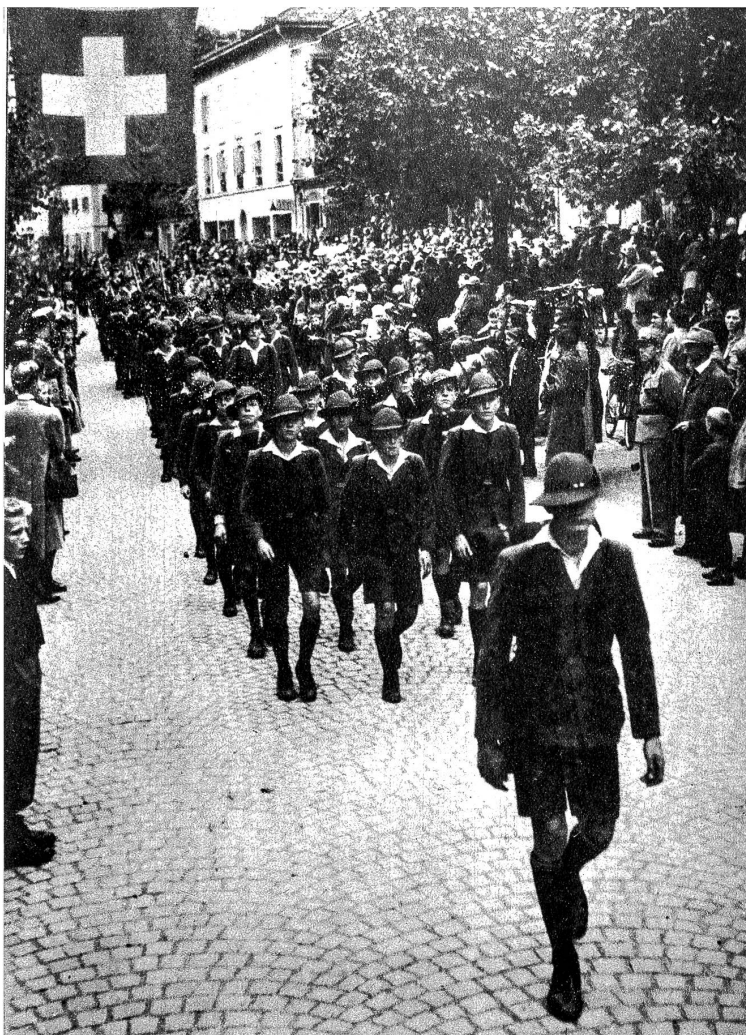
Das Defilee in der Marktgasse am Kadettentag 1943