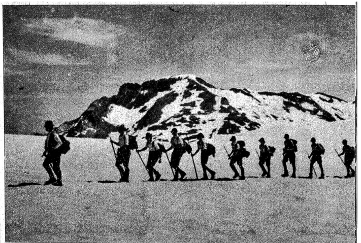
Die Kadetten unternehmen weite Wanderungen. Hier sind sie auf dem Rückmarsch vom Wildstrubel auf Plaine morte

Normalerweise treffen sich die Verbandskorps — Burgdorf, Herzogenbuchsee, Huttwil, Langenthal, Langnau und Thun — im heimeligen, zentral gelegenen Bauerndorf Affoltern i.E. Samstagnachmittag marschieren sie auf und beziehen in den Bauernhäusern ihre Kantonemente. Sonntag früh, nach dem Feldgottesdienst, beginnen die Wettkämpfe, die in kameradschaftlichem Geiste, ritterlich, aber mit Eifer und Anstrengung, ausgetragen werden. Gekämpft wird um drei Wanderfährnchen: Nr. 1 für Vierkampf (Hochsprung, Weitsprung, Kugelstoss und Schnelllauf), Nr. 2 für Schiessen und Nr. 3 für Stafettenlauf. Diese gründlich vorbereiteten und mit aller Exaktheit durchgeführten Anlässe sind bei den Kadetten beliebt, bilden einen Höhepunkt im Kadettenleben.