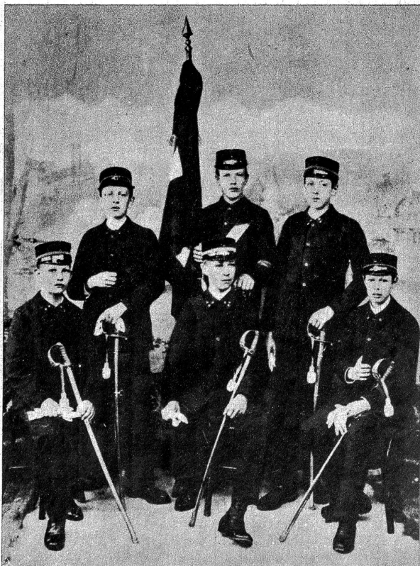
Kadettenoffiziere von Langenthal aus dem Jahre 1894