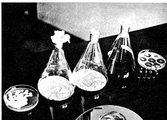
Diese Menge an Penicillin — Schale links — wird monatlich in einer dänischen Fabrik hergestellt. Es sind 200 Gramm, die zur Heilung von 20 Patienten genügen