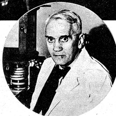
Prof. Dr. Alexander Fleming, der Erfinder des Penicillins, wurde für seine Verdienste vom englischen König in den Adelsstand erhoben. Die Meldung, wonach er den Nobelpreis für Medizin erhalte, hat sich indessen nicht bestätigt