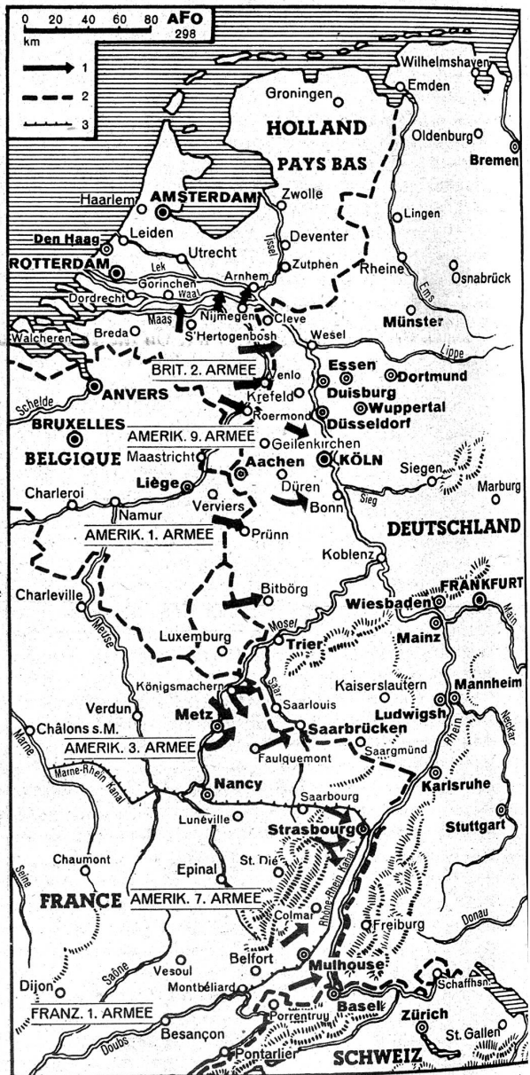
Die Grossoffensive der Alliierten im Westen. 1 = Angriffsrichtungen der alliierten Armeen. 2 = Landesgrenzen. 3 = Wasserstrassen (Kanal) nach Meldungen beider Kriegsparteien