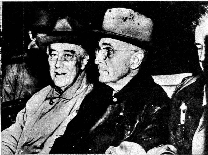
Nach dem demokratischen Wahlsieg in den USA kehrt der zum vierten Male gewählte Präsident Roosevelt nach Washington zurück. In der Mitte der neue Vizepräsident Truman Rechts aussen erkennt man den scheidenden Vizepräsidenten Wallace