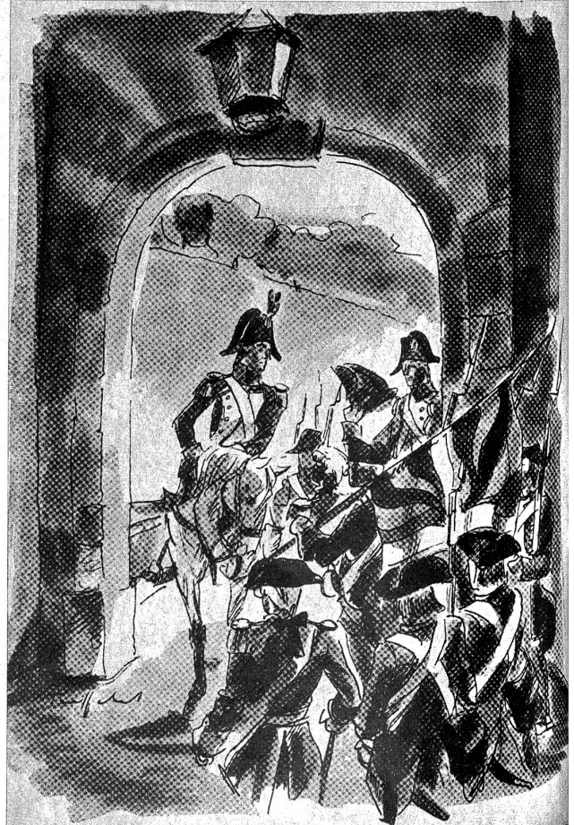
Der Rovérea zieht y. (Illustration von F. Traffele in der Jubiläumsschrift «250 Jahre Reismusketenschützen-Gesellschaft Bern»)

« La capitale arbora soudain ses anciennes armoiries, fit flotter ses couleurs sur ses murs, réhabilita son ancienne magistrature, et tout dans son enceinte respira le bonheur et l'allégresse... » erzellt der Oberscht Rovérea i syne Mémoires. « Mais — fährt er furt — « revenu de la première ivresse, la métamorphose qui venait de s'opérer plus mürement considérée, avait plutöt l'éclat d'un coup de théâtre que la consistance d'une restauration durable. » So isch es gsy. Ds französische