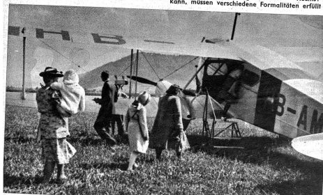
In Mäntelchen und Mützen gehüllt, eine Wolldecke unter dem Arm, steigen die kleinen Patienten mit ihren Betreuern ein, in das bereitstehende Flugzeug (Zens.-Nr. 6216)