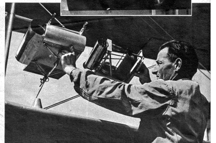
Unterlassen wird der Meteorograph, welcher die Flughöhe, die Lufttemperatur und die Feuchtigkeit registriert, in Gang gesetzt