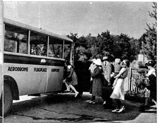
Beglückt vom herrlichen Heißflug besteigen jung und alt den Autobus, um sich in die Stadt zurückfahren zu lassen