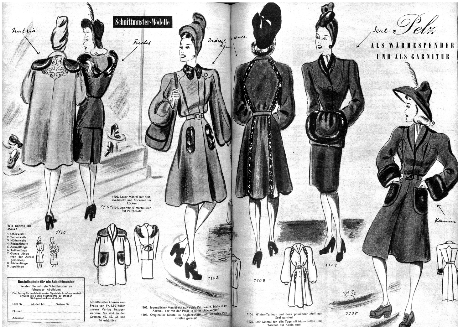
1100. Loser Mantel mit Nutria-Besatz und Stickeret im Rücken 1101. Apatier Wintertailleur mit Pelzbesatz