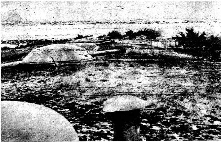
Eine Ironie des Krieges vermittelt uns dieses Funkbild. Die Deutschen umgingen 1940 die Maginotlinie, um dann die Geschütze durch eigene zu ersetzen. Jetzt feuern die Alliierten mit Krupp-Kanonen und erbeuteter deutscher Munition gegen Deutschland