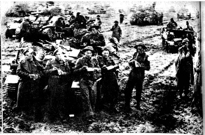
Mit ihren Kleintanks haben sich einige Angehörige der alliierten Luftlandarmee in Holland zur Landarmee durchschlagen können

gelte. Alsdann sei der deutsche Sieg sicher, und der Rest des Krieges gliche einer kurzen, heitern Jagd, verglichen mit der furchtbaren Arbeit von Jahren... seit Stalingrad.