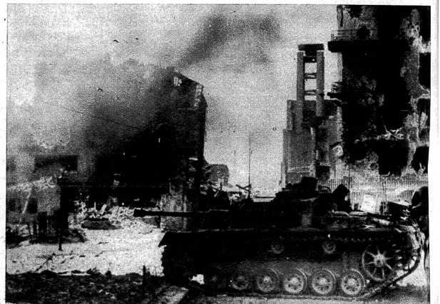
Die Tragödie von Warschau