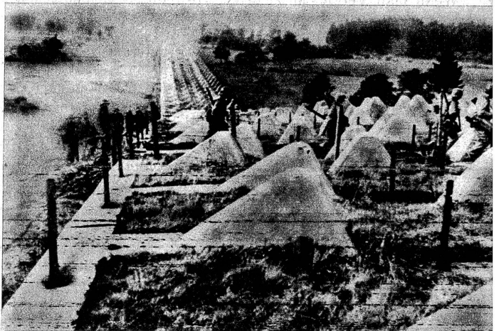
Funkbild von der Siegfriedlinie: Amerikanische Infanterie passiert die Tanksperren

Mit grosser Zuversicht wird in Berlin verkündet: «Deutschland ist wieder im Kommen!» Die Westfront hätte sich demnach gleich wie die Ostfront stabilisiert. Alle weiteren Angriffe der Alliierten würden ihnen nichts anderes als schwere Verluste einbringen. Die totale Mobilisierung würde ihre Früchte zeitigen, und wenn erst die V2 zum Einsatz gelange, müsse sich das Blatt wenden. Nach verschiedenen Gerüchten und Beschreibungen soll diese Raketenbombe furchtbare Wirkungen haben. Kilometerweit würde entweder durch eine unvorstellbare Lufterschütterung jedes lebende Wesen umgebracht, oder dieselben Effekte kämen infolge einer «Atomzertrümmerung» zustande. Man hat in England teils mit Achselzucken, teils mit aufmerksamen Ohren registriert, was die Gefangenen sagen. Sie sollen in der Tat unter der Suggestion stehen, dass es nur bis zum Einsatz dieser Ueberwaffe auszuhalten