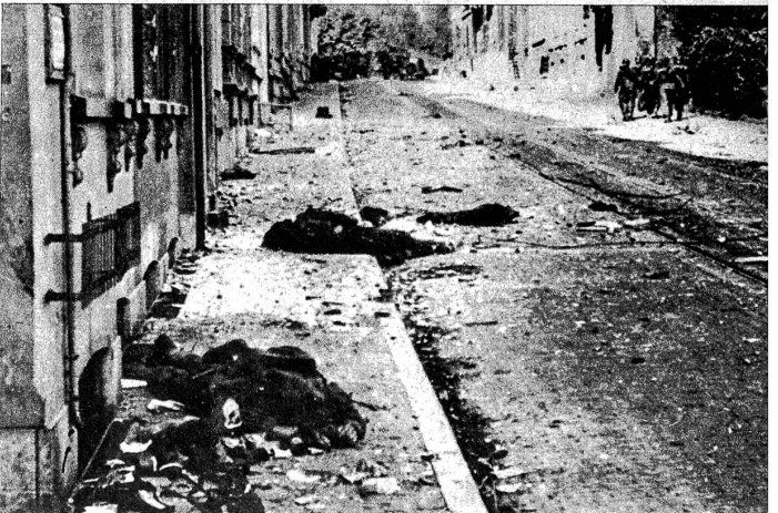
Der Kampf um Arnheim. Haus für Haus musste von den Deutschen erkämpft werden. Die tapferen Fallschirmsoldaten liessen grosse Opfer an Menschen zurück

Links: Die erste alliierte Luftlande-Armee General Brereton's in Holland ist in eine äusserst kritische Situation geraten, nachdem es den Deutschen gelang, den Korridor, der die Verbindung mit den Landarmeen herstellte, zu durchstossen. Verstärkungen durch Fallschirmtruppen vermochten die äusserst heikle Situation noch zu retten