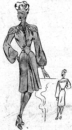
Kleines Abendkleid mit der neuen runden Schulter, die reich mit Pailletten bestickt ist