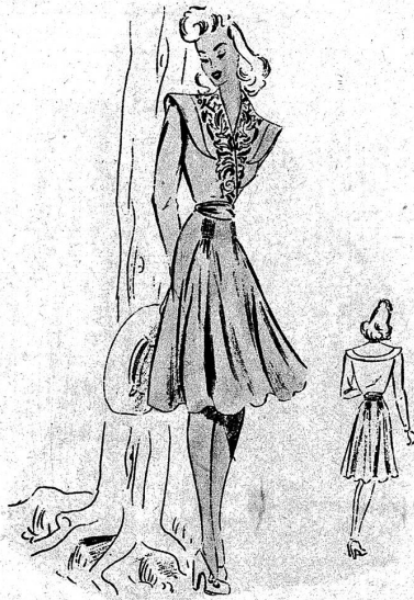
Jugendliches Kleidchen mit reich besticktem Vorderteil

Wie schon im Frühjahr hat auch jetzt gegen Herbst zu das interessante Modeheft von Willy Müller, Broderie und Chemiserie, Waisenhausplatz 21, Bern, wieder seinen Weg auf unsern Redaktionstisch gefunden. Alt ist es in seiner gediegenen äussern Aufmachung geblieben. Inhaltlich aber bringt es eine Unmenge neuer und schönster Ideen, die eine Auswahl wirklich schwer werden lassen. Da findet man vor allem viele Kleidchen für jung und alt in raffiniert einfacher Linie, aber nach den neusten Richtungen der Mode mit schönster Stickerei verziert. Vorderteil, Taschen oder Aermel sind bestickt und erzielen dadurch ganz neue Effekte, die eine weiche weibliche Linie schaffen und den Charme der Frau hervorheben. Andererseits sind viele schöne Modelle in Jackettkleidern und Mäntel vorhanden, die durch die Stickerei gewaltig gewinnen. Sogar ein schmissiger Sportdress mit Kapuze lässt erkennen, dass selbst bei