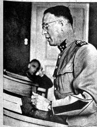
Der Verteidiger hat das Wort. Bezeichnet der Angeklagte selbst keinen Verteidiger, so ernennt der Grossrichter einen solchen. Jeder rechtskundige Offizier der Division ist verpflichtet, die Verteidigung zu übernehmen.

Obwohl die Verhandlungen der Militärgerichte in der Regel öffentlich sind, dringt eigentlich sehr wenig über die Tätigkeit dieser Gerichte an die Öffentlichkeit, so dass vielfach unter der Zivilbevölkerung — und zum Teil unter den Soldaten selbst — oft eine ganz falsche Vorstellung über die Zusammensetzung und Arbeitsweise dieser Gerichte vorhanden sind. Auch hier, wie bei