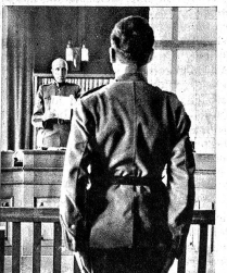
Das Urteil ist gefunden. In guter Haltung nimmt es der Angeklagte entgegen. Er ist Soldat. Er hört auch auf die ermahnenden und aufrichtigen Worte des Grossrichters, die ihn auf den richtigen Weg zurückweisen.