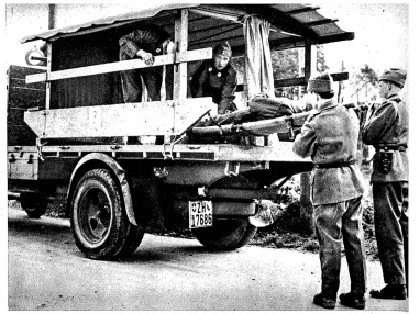
Die Bundesfeiersammlung 1944 steht sowohl im Zeichen eidgenössischer Wehrhaftigkeit als auch eidgenössischen Helfens. Der Wehrwille wird durch das Gedenken an die Schlacht von St. Jakob an der Birs, der Helferwille durch die Zuweisung der Bundesfeierspende an das Schweiz. Rote Kreuz zum Ausdruck gebracht.