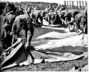
Rotkreuz-Kolonnen wurden organisiert und in beträchtlichem Mass ausgerüstet und die Mannschaft für Dienstleistungen ausgebildet. (III Lg 9137, III Lg 9138)