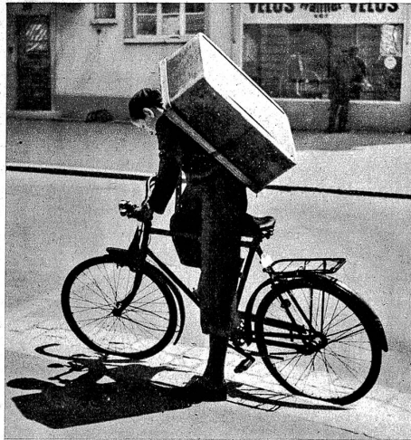
Links: Nun geht's auf die Tour. Die Sonne brennt tüchtig auf den hölzernen Buckel und macht ihn dann manchmal doppelt schwer

Wenn wir der vielen Arbeitskategorien, die zusammen unsere zahlreichen und mannigfaltigen Geschäftsbetriebe ausmachen, vor unseren Augen Revue passieren lassen, da dürfen wir des untergeordnetsten der «Aemter» nicht vergessen. Wir meinen den «Wochenplatz».