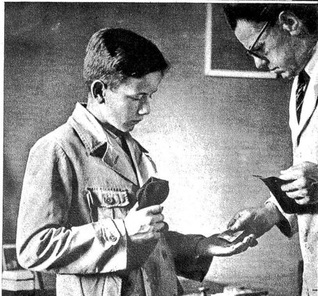
Links: Zahltag! Der schönste Moment der Arbeitswoche. Der hilft über die Mühsale mancher struben Tage hinweg