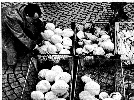
Wie schön sieht der Kohl aus! Dagegen ist wirklich nichts zu sagen!... Alles sauber in diesen neuen Gitterkörben!... Doch werden die Liebhaber der malerischen Bilder die echten alten Weidenkörbe bedauern...