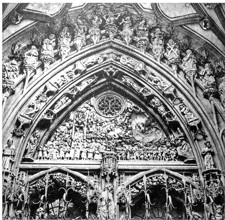
Links: Im grossen Feld über den beiden Türen wird in Reliefs und zahllosen Figuren das jüngste Gericht dargestellt. Links stehen die Guten, die Heiligen, und bereits darf ein Papst durch die enge Pforte des Paradieses eintreten, während der Kaiser noch warten muss. Gegenüber allerdings, wo schon allerlei Fürsten im Fegfeuer schmoren, wird auch ein Papst kopfüber in die Flammen gestürzt.

rühmten Ulrich Ensinger, der dem Ulmer Münster seine endgültige Gestalt verliehen hätte und auch Erbauer des Strassburger Münstersturmes war. Der Sohn war von des Vaters Kunst und Wissen tief beeinflusst und doch ein selbständiger, kraftvoller Charakter. Er hätte nach dem Tode des Vaters dessen Werk weiterführen sollen, geriet aber in Streit mit den Strassburgern und leistete daher dem Ruf der Berner um so lieber Folge.