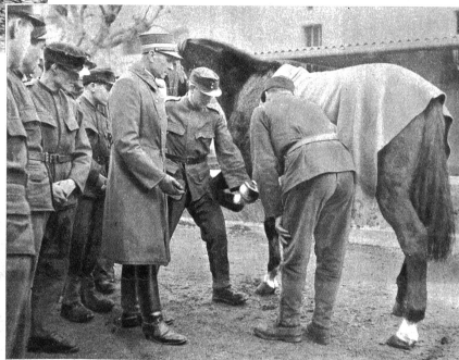
Oben links: Nun kommt das erste Eisen auf den lebenden Pferdeshuf, nachdem es für die entsprechende „Schuhnummer“ zugerichtet wurde

Das ehrsame Handwerk des Hufschmiedes ist wieder zu Ehren gekommen. Seit die Strassen nicht mehr unter dem Diktat des Benzins stehen und besonders seit die Bedeutung des landwirtschaftlichen Mehraufbaus mehr als bisher in Erscheinung tritt, kommt der Pferdewagen wieder zu seinem Recht, damit aber auch der Hufschmied. Gilt dies in hohem Masse für das zivile Leben, so hat es noch viel mehr Geltung für alles militärische Tun und Lassen. Die Militärbehörden waren ohnehin genötigt, gleichzeitig konservativ und fortschrittlich zu sein. Sie haben der Motorisierung der Armee ihr Augenmerk gewidmet und durften dennoch den Pferdezug nicht vernachlässigen. Der Militärfufschmied hat darum von jeher eine sorgfältige fachliche Ausbildung erfahren. Er trägt das Zeichen seiner Würde auf dem linken Rockärmel in Form eines Hufeisens, und diese Auszeichnung ist nicht leicht erworben worden. In steter praktischer und theoretischer Schulung werden die Militärfufschmiede hängengebildet, und es ist ein schönes Zeichen der Verbundenheit von Volk und Arme, wenn den Soldaten auch für das viele Leben bleibende Werte vermittelt werden.