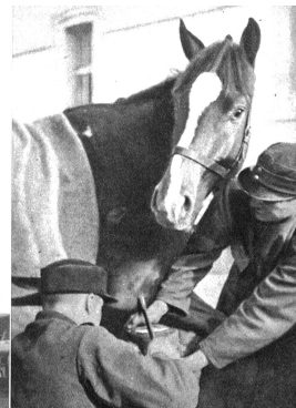
Oben: Nachdem das Hufeisen gut angepasst ist, wird es mit sieben bis acht Nägeln auf der Hornkapsel befestigt, ohne dass der „lebende“ Teil des Hufes berührt werden darf. Der „Bless“ selbst schaut der Arbeit neugierig zu