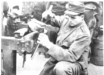
Viele Hammerschläge und manchen Schweisstropfen braucht es, bis ein Hufeisen vollendet ist. Unter Kontrolle wird das Eisen auf den „Joten“ Huf genogelt