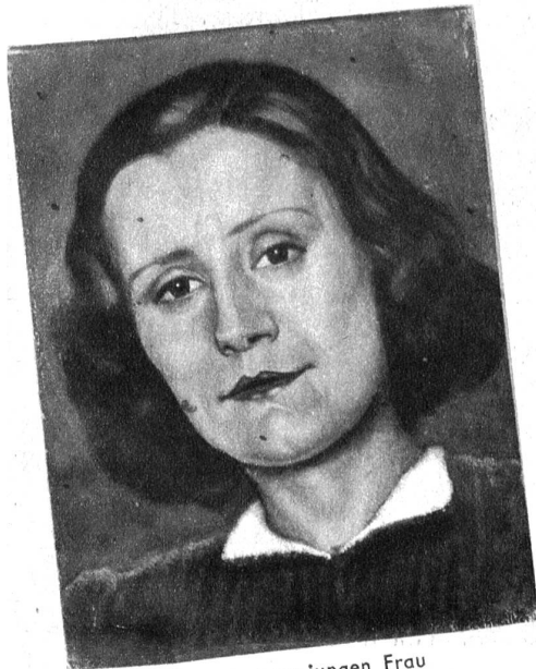
Portrait einer jungen Frau

Künstler sind eigene Naturen, die abtastend und unsicher oft erst nach langen Umwegen ihre eigentliche Bestimmung erkennen und die ihr Ziel meistens erst nach vielem Suchen und mühsamem Arbeiten erreichen können. So ist es dem noch ziemlich unbekann-