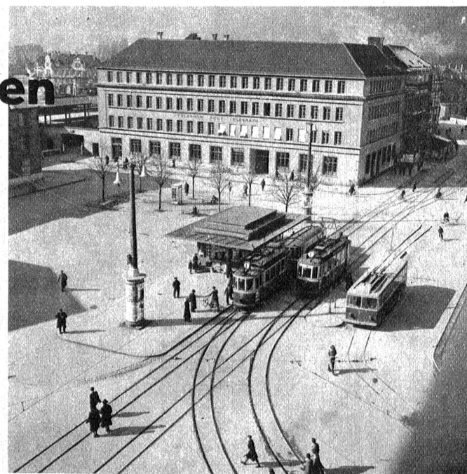
Am Bahnhofplatz, im Hintergrund das neue Gebäude der Hauptpost

kleiner waren, als auf dem Flugplatz östlich der Stadt die Maschinen des Flugdienstes landeten. Die Bedeutung Biels als Verkehrsknotenpunkt leitet sich aus der Topographie des mittlern Teiles des Jurabogens her. Hier kreuzen sich zwei Hauptverkehrslinien, von denen die nord-südliche internationale Bedeutung hat. Dem Fusse des Juras entlang führt die Linie Westschweiz-Ostschweiz durch und von Norden kommend leitet der mittlere der verschiedenen Juradurchstiche den Verkehr aus Ostfrankreich und dem Rheinland über Biel nach dem Lötschberg und dem Simplon, nach Italien.