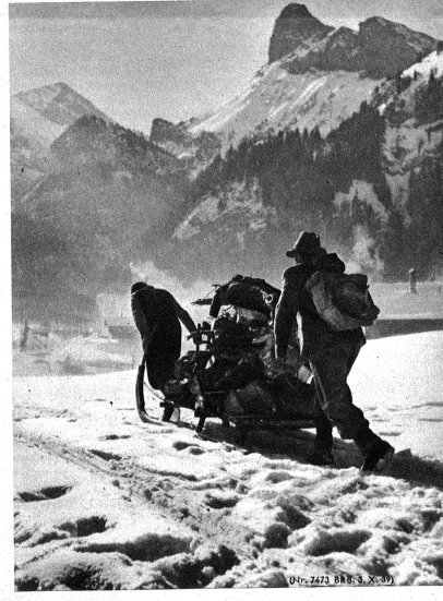
Oben: 2473 BRB, S. X, 39

die Kandersteger waren während manchem Jahr gefürchtet bei den nationalen Skilangläufern. Es sei nur jene Militärpatrouille erwähnt, die 1936 und 1937 die Siege an den nationalen Militärwettkämpfen holte und die aus nicht weniger als drei Ogis bestand und einem Kilianzi, der auch aus Kandersteg stammt. Unser Bildbericht erzählt nun von diesen Ogi in Kandersteg.