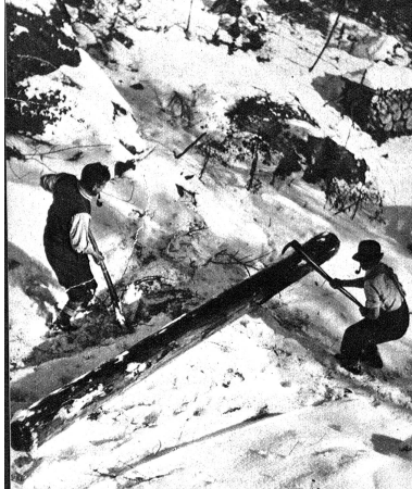
Unten: Da brauch't's Geschicklichkeit, aber Kilian und Hermann verstehen es ausgezeichnet, mit dem „Zopi“ umzugehen, mit dessen Hilfe sie die Baumstämme zu Tal befördern