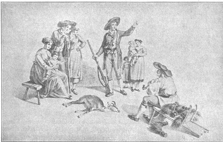
Heimkehr von der Gamsjagd

Jeanne betrachtete ihren Mann, der sich etwas abgewandt hatte, aufmerksam, dann sagte sie, den Kopf schüttelnd, mit starker Betonung: „Nein, das hat der Franz nicht getan! Glaub mir — das hat er nicht getan — das nicht!“