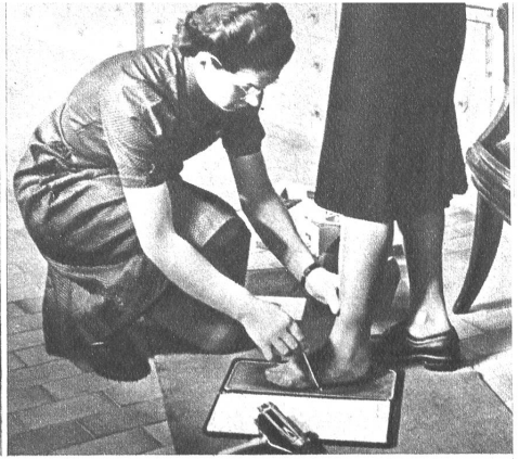
Links: Ein gesundes Unternehmen, das sich dauernd entwickelt, bildet in seiner Eigenart eine starke Stütze des Allgemeinwohls. — Oben Mitte: Absolute Präzisionsarbeit charakterisiert den Herstellungsprozess. — Oben rechts: Für besonders empfindliche Füße ist die Möglichkeit vorhanden, die plastische Innensohle nach dem eigenen Fussabdruck einzubauen