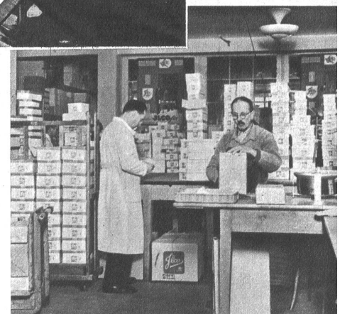
Vom grossen Lager aus werden die Schuhhändler in Stadt und Land mit ILCO-fix-Schuhen versorgt. 2000 Schuhhändler in der ganzen Schweiz arbeiten mit der ILCO-Organisation zusammen