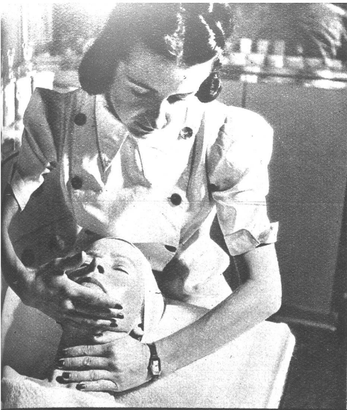
Halsmassage. Unten: Endgültige, narbenfreie Entfernung von Haaren, Warzen und Muttermalen durch Diathermie