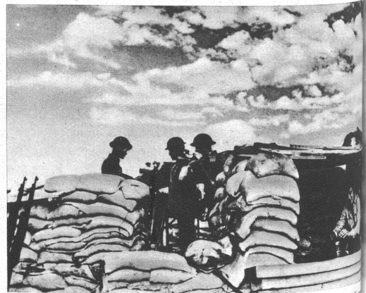
Die Amerikaner helfen sich bei der Verteidigung mit den ihnen zu Gebote stehenden Mitteln. Um heftiger Angriffe halten sie ihre Stellungen nicht immer aus bombensicheren Unterständen bestehen

Die Verteidigung der Philippinen durch den General MacArthur bedeutet eines der wichtigsten Ereignisse im Pazifik. Die obere Karte zeigt anschaulich, wieso es möglichst war, die Japaner aufzuhalten und die Benützung des Hafens von Manila zu unterbinden. Die amerikanischen Truppen halten ihre Positionen auf der Batan-Halbinsel und auf der Insel Corregidor. Dieser Stützpunkt beherrscht den Eingang des Hafens von Manila in überragender Weise.