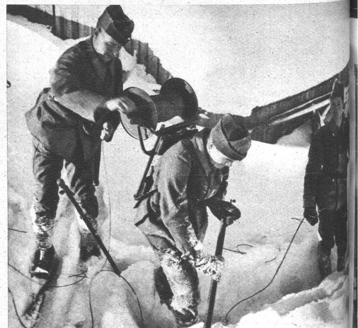
Kein Vergnügen, Leitungsbau im metertiefen Schnee! Das Bild am Rücken wiegt mit der vollen Rolle an die 30 kg