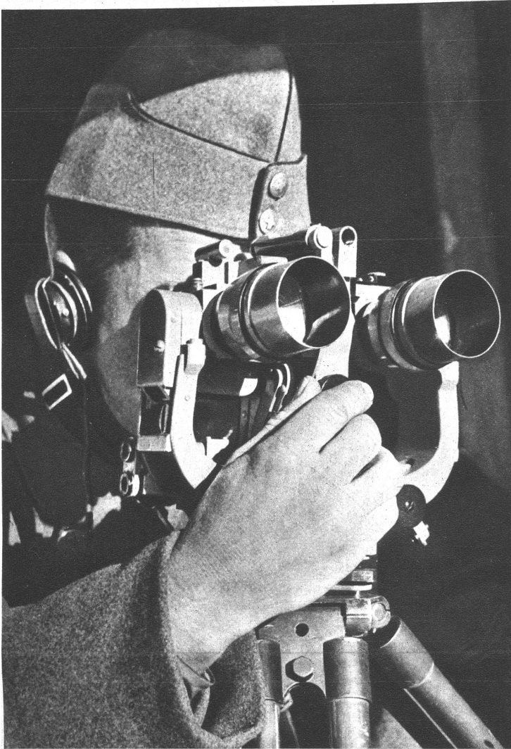
Er sieht alles, was auf dem Zielgelände vorsichgeht und meldet die Beobachtungen laufend durchs Telefon auf die Zentrale. Artillerie-Beobachter am Theodolit

(Bew. Ter. Kdo. 11 3. V 41 R. H. D. 518, 526, 538. Ter. Kdo. III 5750-5751)