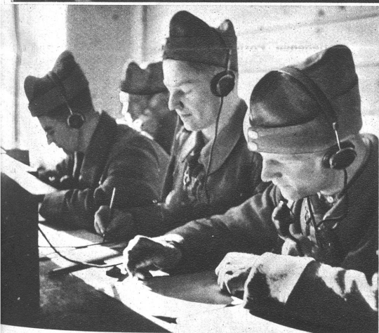
Die Zentralenmannschaft notiert laufend die eingehenden Meldungen von den Posten und wertet sie aus