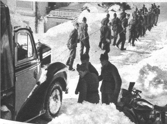
Wolgaschlepper? Nein, bloss die Motorfahrer, welche einen eingefrorenen Wagen wegziehen