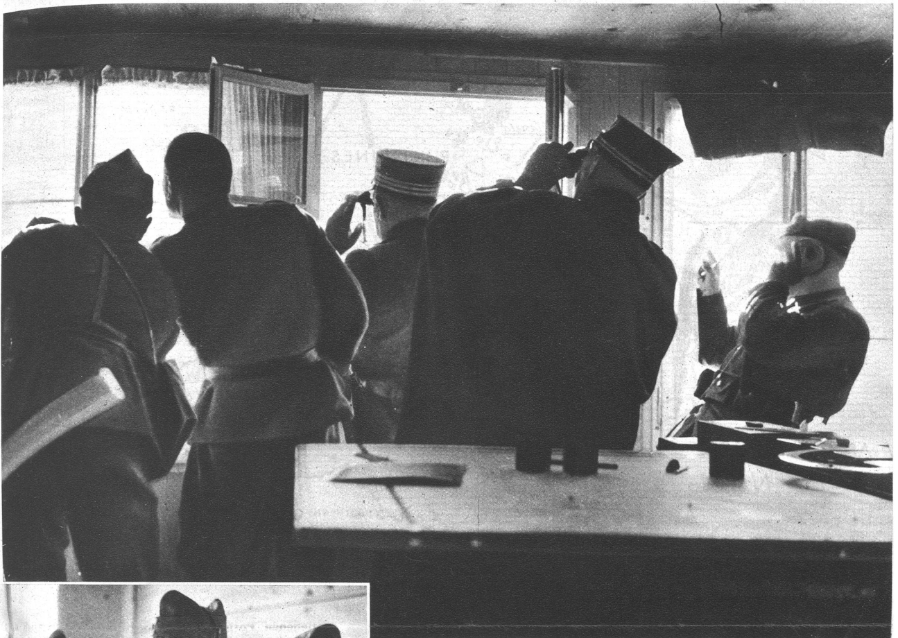
Einschlag! Blitzschnell reißt man auf der Zentrale die Ferngläser an die Augen und verfolgt die aufspritzenden Erdfontänen fern am Berg