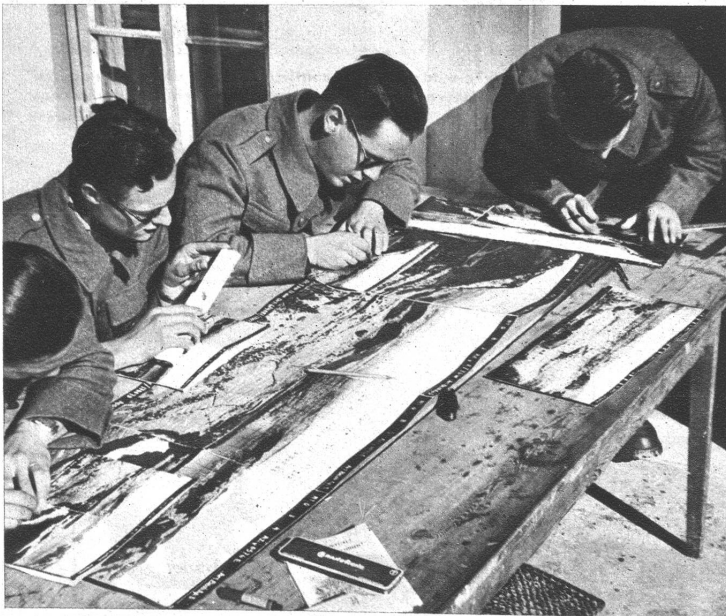
Das Herstellen grosser Photo-Panoramen gehört auch zum Aufgabenkreis der Beobachtungs-Kp. Diese dienen zum genauen Ermitteln von Geländepunkten