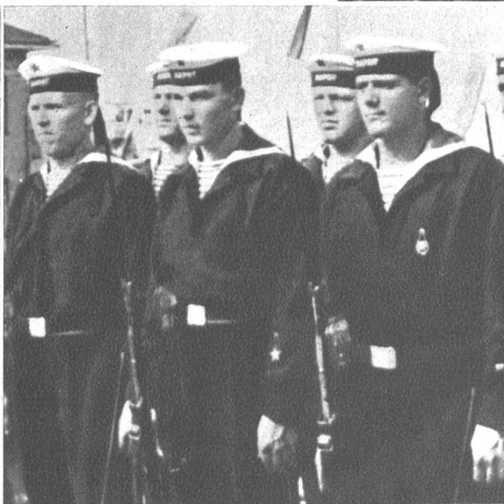
Die russische Schwarzmeer-Flotte beteiligt sich aktiv an den Kämpfen um die Krim und ist den Angriffen der feindlichen Geschütze und Flugzeuge ausgesetzt