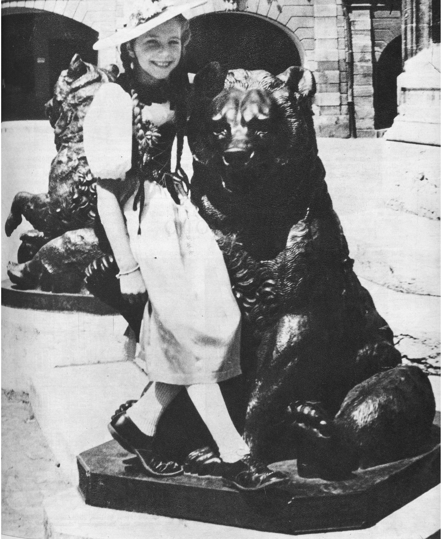
Bärn, mys liebe Bärn . . .