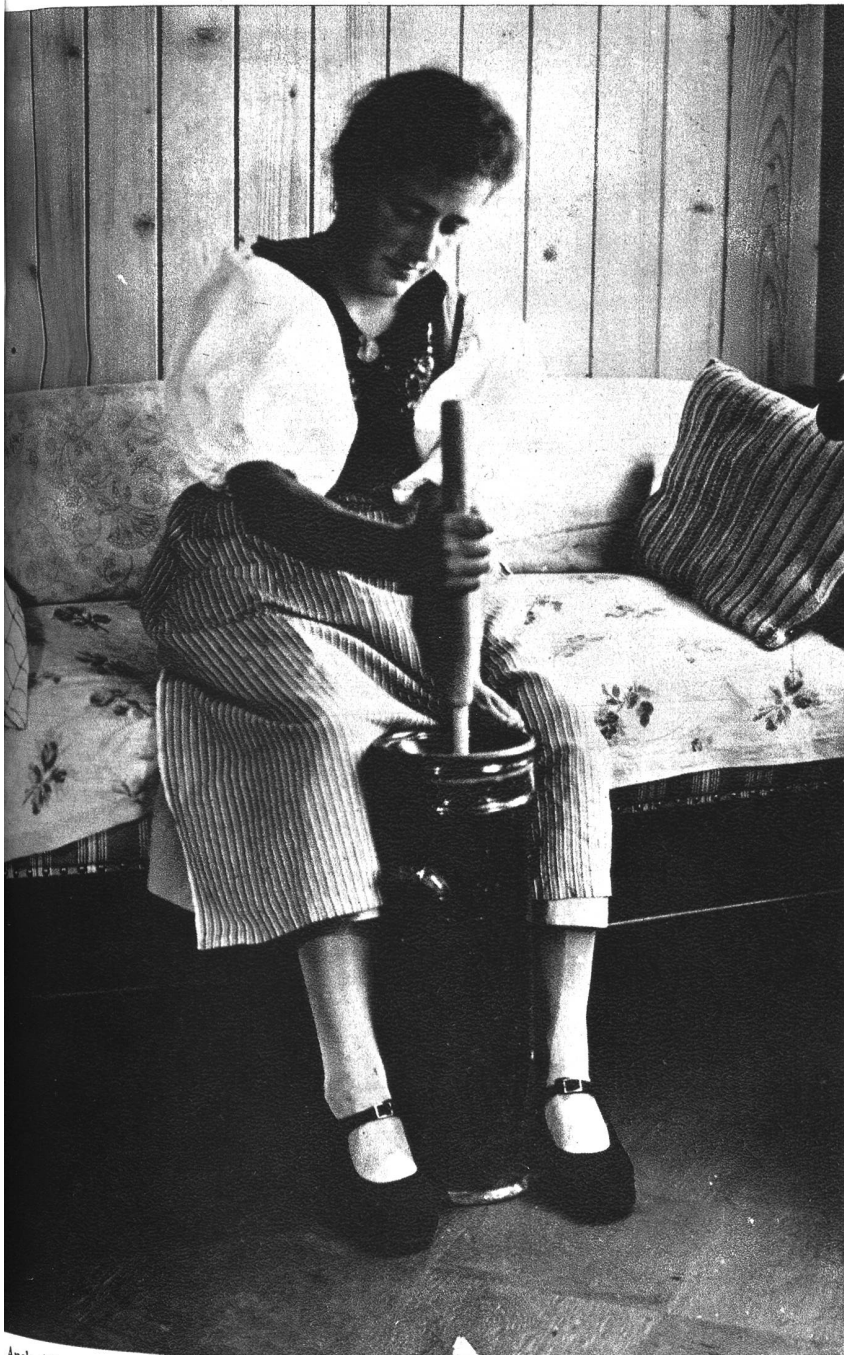
Auch s'Vreneli ist tüchtig am Werk und vor allem sauber und nett.