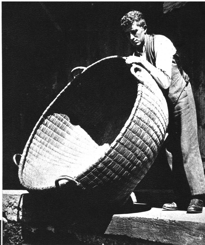
Wenn man schon den Brotkorb in diesen schweren Zeiten höher hängen soll, so macht man ihn einfach grösser und das gleicht aus . . .