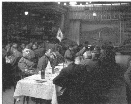
Blick in den Festsaal.