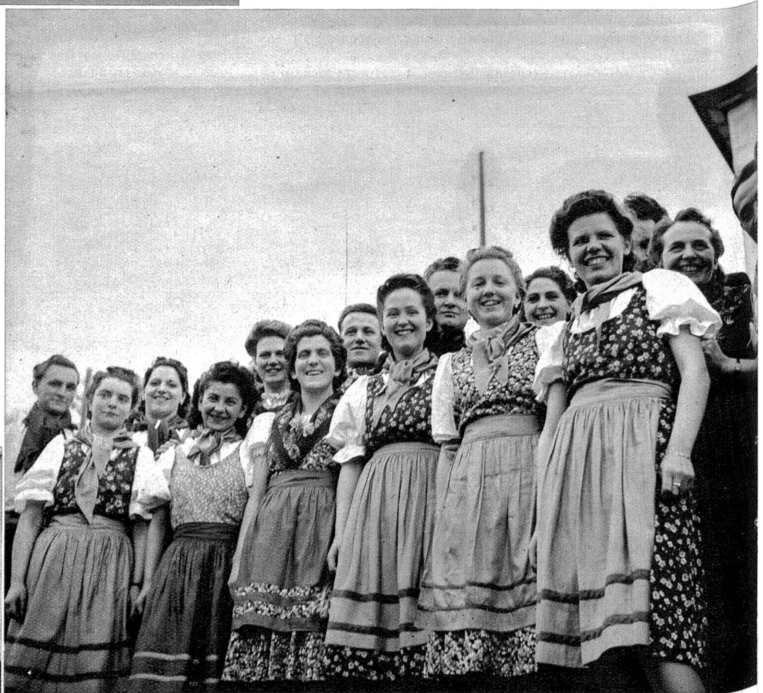
Die Corale Ticinese von St. Immer während des Ständchens, das sie Regierungsrat v. Steiger auf dem Mont Soleil darbrachte.

Mit dem gemeinsamen Mittagessen war die Tagung offiziell zu Ende gegangen. Inoffiziell nahm sie aber ihren Fortgang, indem nun die einen Zeit und Gelegenheit zu einem ausgiebigen Rundgang durch das sympathische Städtchen benutzten; andere fanden sich auf dem Mont Soleil zusammen — sans Soleil allerdings, was jedoch der gehobenen Stimmung (in 1200 Meter Höhe, man versteht das) keineswegs Abbruch zu tun vermochte.