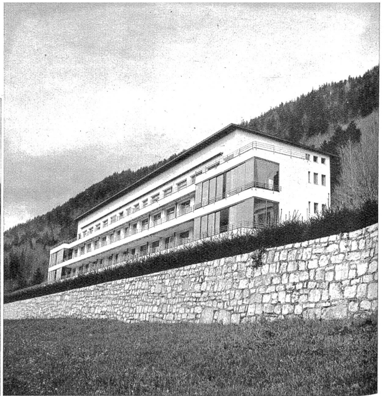
Das moderne Bezirksspital von St. Immer, ein Bau von Prof. Salvisberg (Zürich).