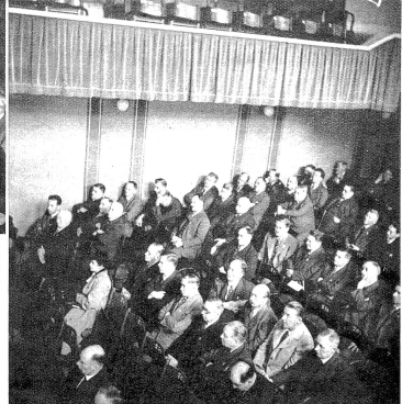
Ein Ausschnitt aus dem Saal des Cinéma de la Paix, wo sich einige 300 Delegierte aus dem ganzen Kanton zum diesjährigen Gewerbeparlament zusammengefunden haben.