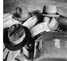
Stilleben in der Garderobe.