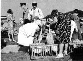
Auf dem Markt in New Bern wird nebst dem Gemüse hauptsächlich ein Geflügel gehandelt.