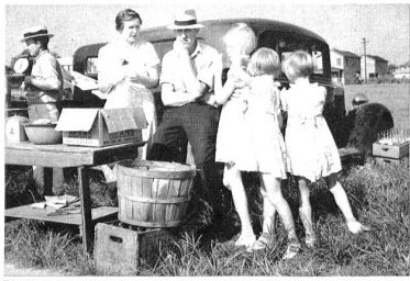
Ein Farmer aus der Umgebung von New Bern. Seine strohblonden Kinder könnten ebensogut an der Bundesgasse in Bern zu treffen sein.

Das Leben, der Wohlstand und die guten Sitten eines Staates, einer Stadt oder einer Gemeinde spiegeln sich nirgends besser wieder, als auf einem einfachen Wochenmarkte. Da vereinigt sich Stadt und Land, da nähert sich der Mensch dem Menschen — das Gemüse bringt sie zusammen. Der Markt von New Bern befindet sich nicht an einer heimeligen Kehler- oder Bundesgasse. Ein „Jibelemarkt“, ein „Meißchmarkt“ mit Tang im Stern oder Kornbausteller kennen diese Berner natürlich nicht. Der gewöhnliche Wochenmarkt befindet sich außerhalb der Stadt, an einer wenig befahrenen Zufahrtstraße, dem Trottoir ent-