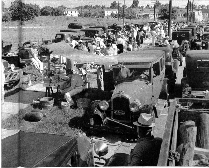
Gesamtansicht des New Berner-Marktes. Der Hintergrund ist nicht die Nationalbank oder das Parlament. Es sind graue Negerhütten, und in der Nähe befindet sich ein Holzgeschäft.