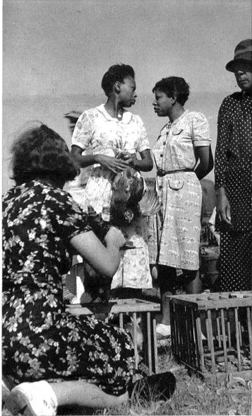
Eine Marktordnung wie bei uns kennt man in New Bern noch nicht. Da werden die Hühner noch an den „Scheichli“ heimgetragen. Zwei „Bernerinnen“ kaufen auf Sonntag ihre Poulets.