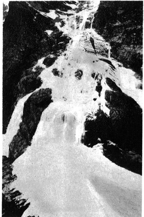
Grindelwald. Die Schloss-Lauene von der Bäregg aus gesehen.