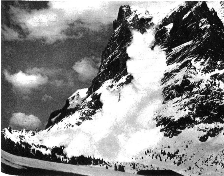
Die Wetterhorn-Lawine bei Grindelwald.