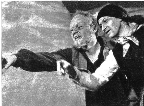
II. Akt, 1. Bild: Der Knecht Alois und die Kräuterfrau Barbara.

feindlichen Einfälle bereits zum Opfer gefallen. Eine neue Regierung wurde für die Eidgenossenschaft eingefekht. Aber im Kanton Nidwalden lehnten sich die Bauern gegen diese und die Fremdherrschaft auf. Hier in Nidwalden besitzt Sepplis Vater ein kleines Bauernhaus. Das Stück Land, auf dem es steht heißt „Das Kniri“. Darum führt auch Seppli Amstad den Namen „Kniri-Seppli“. Seppli soll am nächsten Morgen mit seinem Vater auf die Alp gehen und dort den Sommer über Röhre und Geißeln hüten. Marieli Ackermann, die Tochter des Nachbarn, verspricht Seppli einmal auf der Weide zu besuchen und den lustigen Knecht Alois, genannt „Wisu“ mitzubringen. Die Bauernschaft ist zwar ziemlich beunruhigt ob der drohenden Kriegsgefahr, aber man hofft, daß sich noch alles zum Guten wenden könne und daß die Sommerweide nicht werde unterbrochen werden müssen. Erst im späten Sommer kommen Marieli und Wisu zu Seppli auf die Alp und freuen sich der schönen Tage und der herrlichen Bergwelt.