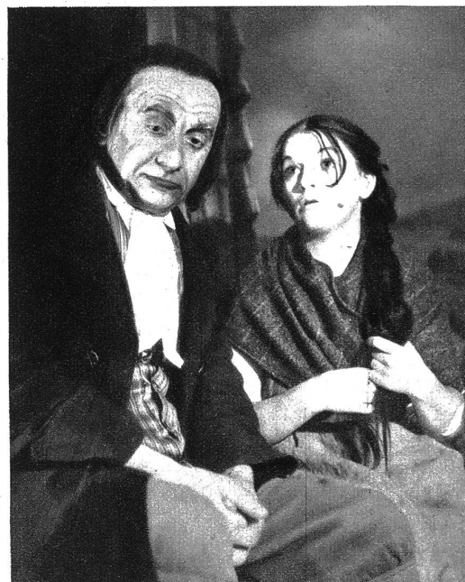
III. Akt: Vater Pestalozzi und Marieli.