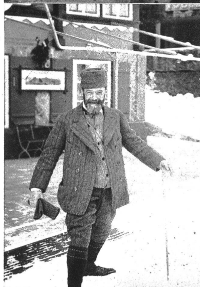
Ferdinand Hodler, aufgenommen vor „Steuris Pint“ in Grindelwald, im Jahr 1912.