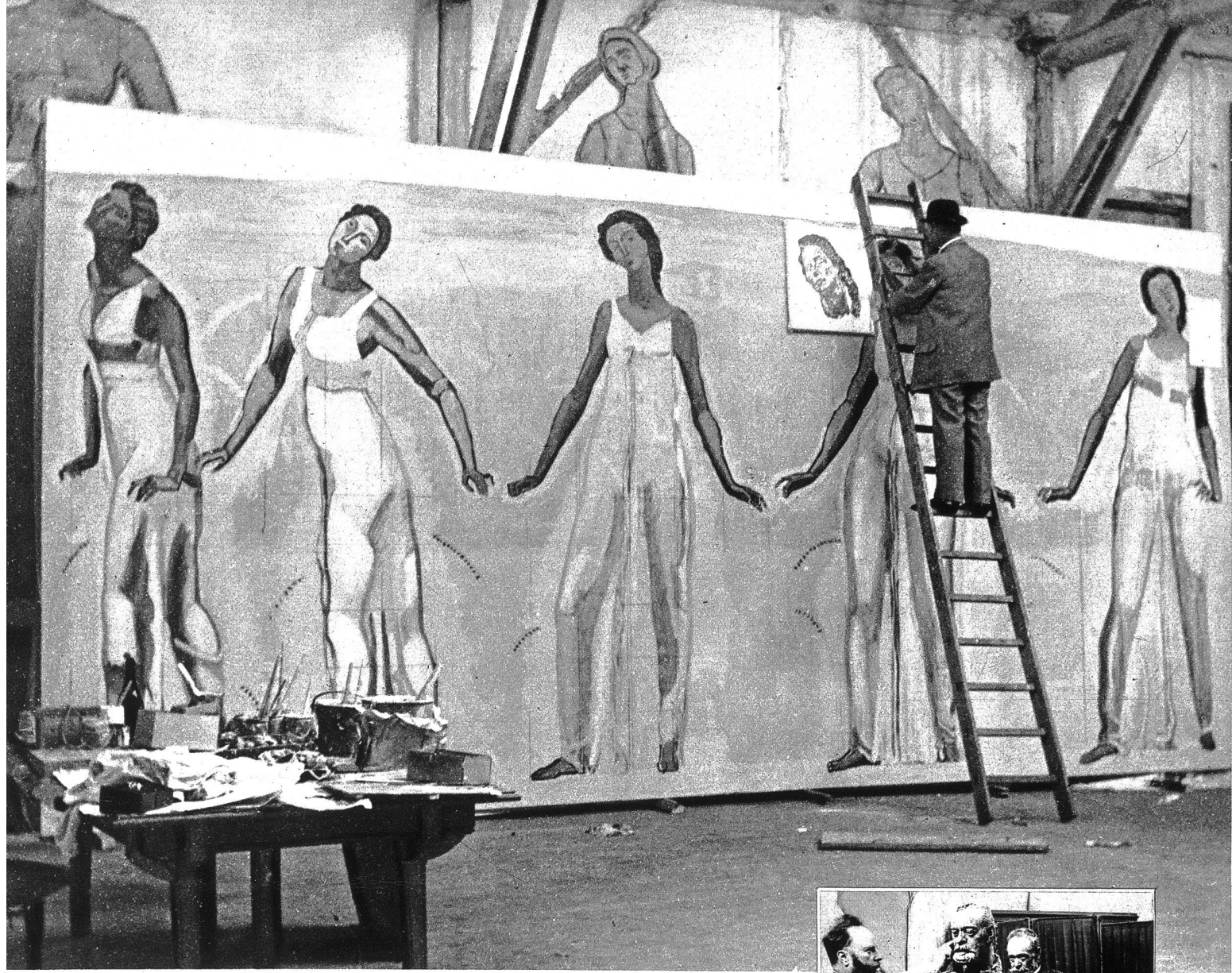
Hodler arbeitet am „Blick in die Unendlichkeit“. Interessant sind die riesigen Figuren aus Karton hinter dem Bilde. Hodler benützte diese, um die Stellung der Figuren auf dem Bilde gegeneinander genau zu fixieren.