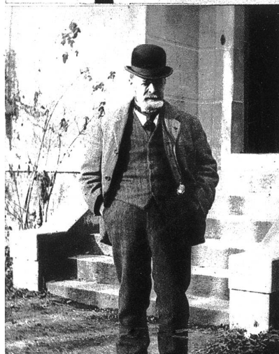
Hodlers Atelier war wegen seiner Grösse nur schwer zu erheizen. So sah man den Maler selten ohne „Gox“ und die warmen Holzschuhe