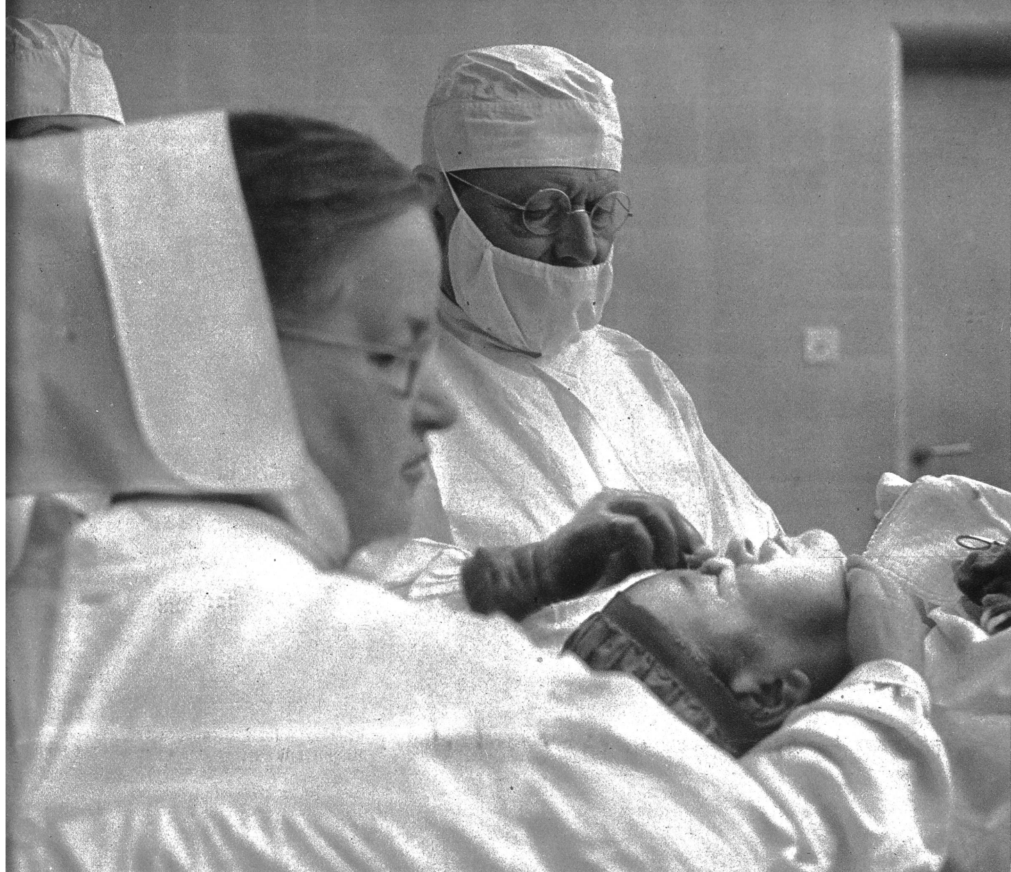
Professor de Quervain bei einer Gesichtsplastik. Links die Narkosenschwester, die tüchtige Helferin