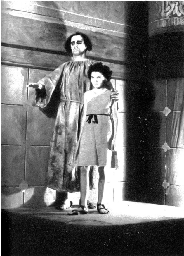
Der geblendete Samson geht zum Säulenpaar