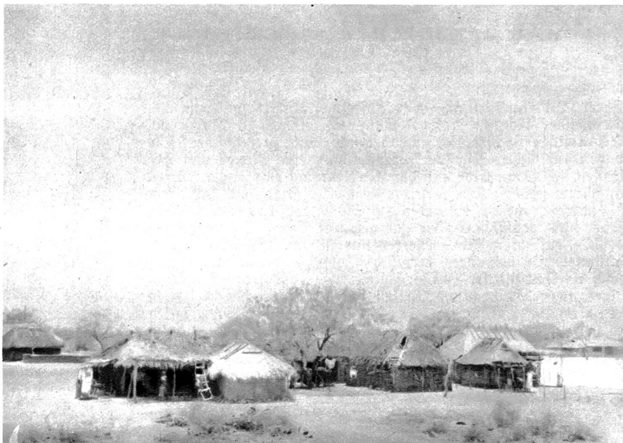
Indianerbehausungen in Mexiko