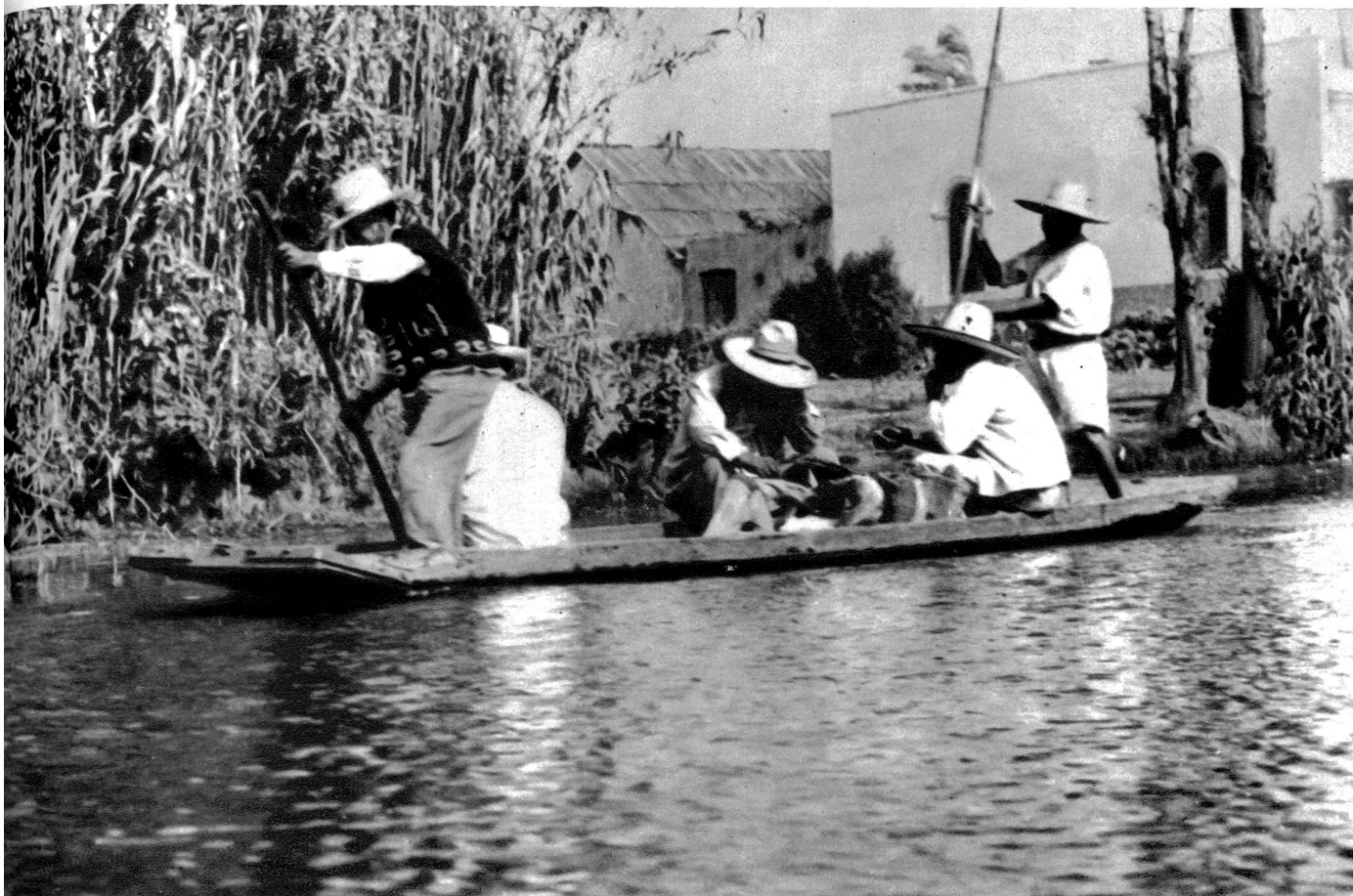
Indianer auf ihrem flachen Boot auf dem Wege zum Felde