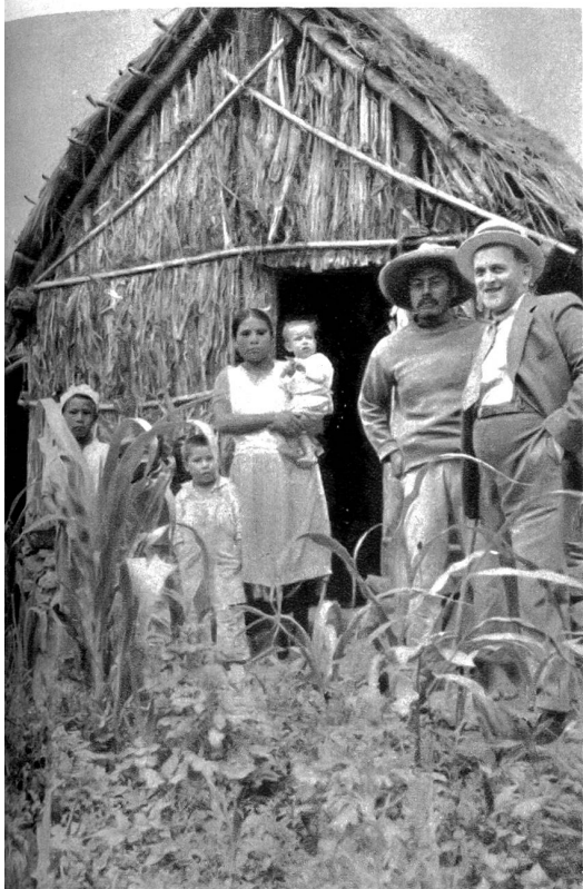
Mit einer Indianerfamilie im Indio-Dorf Xochimilco vor ihrer Hütte