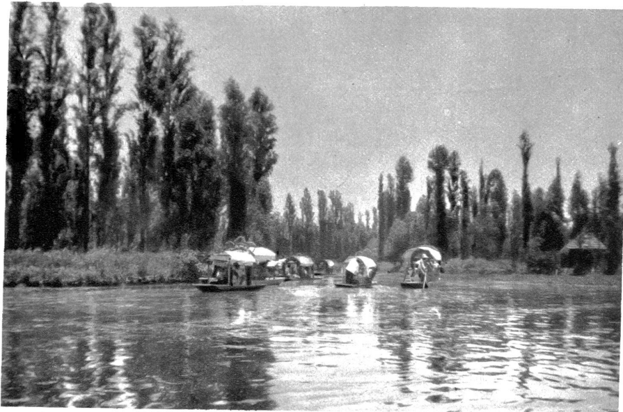
Sonntags rudern die Indianer mit geschmückten Booten durch die Kanäle nach Xochimilco zum Gottesdienst