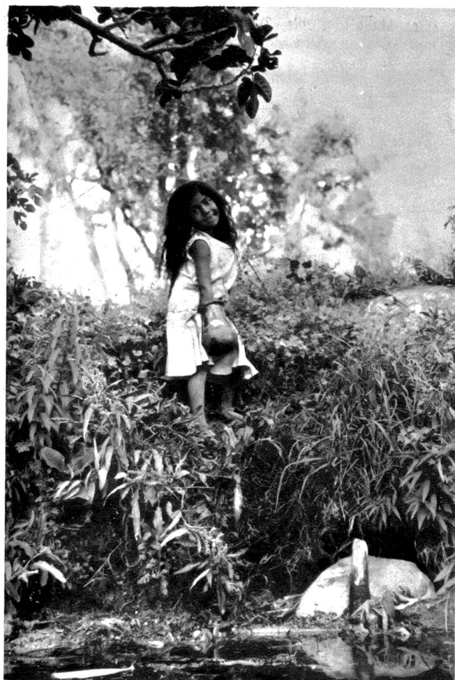
Indianerkind beim Wasserschöpfen

Langsam fuhren wir nun in unseren Wasserstraßen weiter. Die Indianer sind auf das Geld aus, wie der Teufel auf die Seelen! Was verschachert werden kann, wird verschachert. Ein Indio baut auf seinen Feldern, einer dieser kleinen schwimmenden Gärten, Gemüse und Blumen aller Art und liefert dann seine Produkte nach dem Hauptmarkt in Kochimilco, von wo sie dann wiederum auf dem Wasserweg durch den Vigo-Kanal, mit der Bahn oder per Auto nach der Hauptstadt Mexiko verfrachtet werden. Mexiko-City bezieht das ganze Frischgemüse von den Indianern aus Kochimilco.