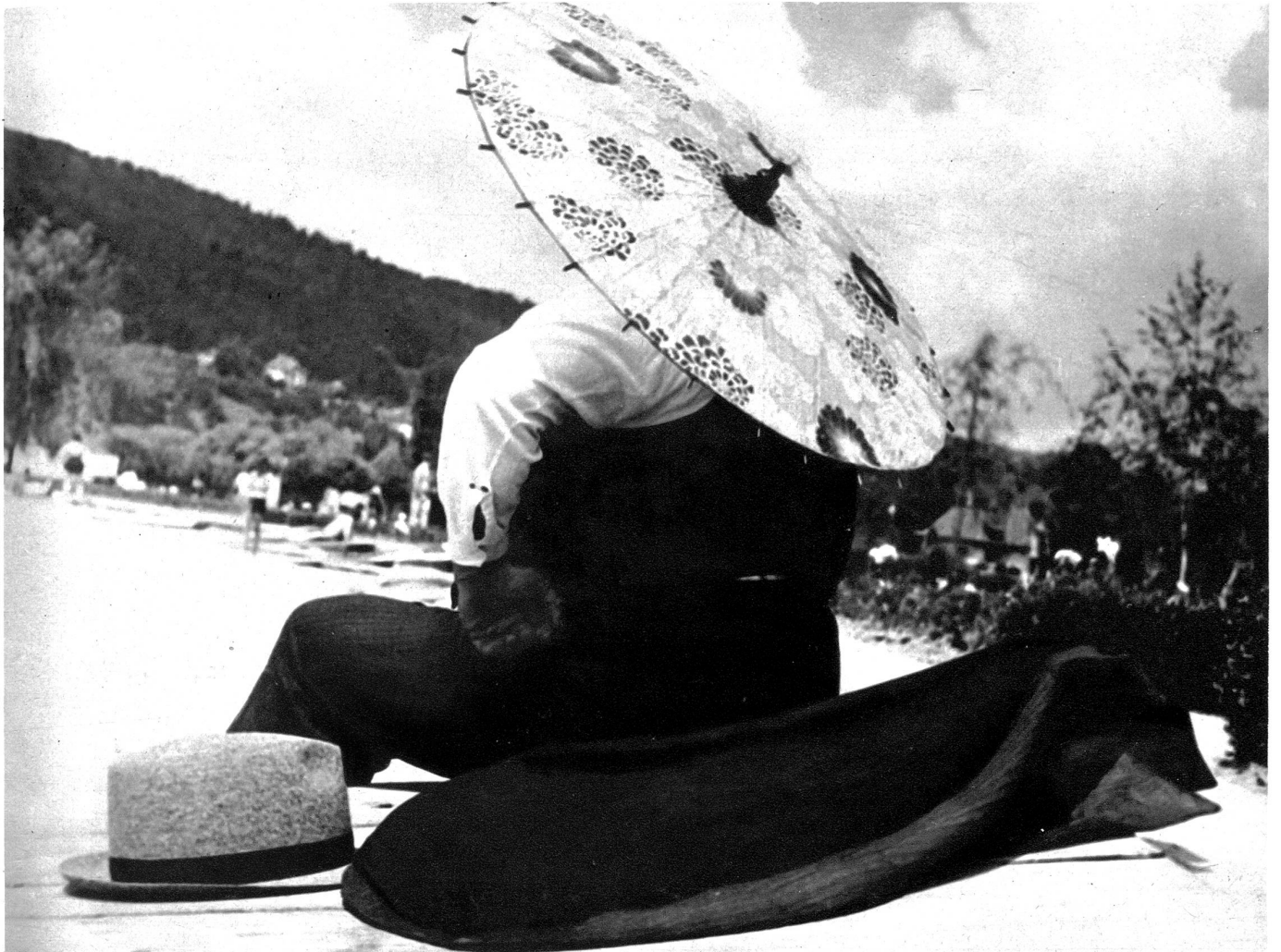
Er zieht vor, unter dem Sonnenschirm seiner Gattin auszuruhen