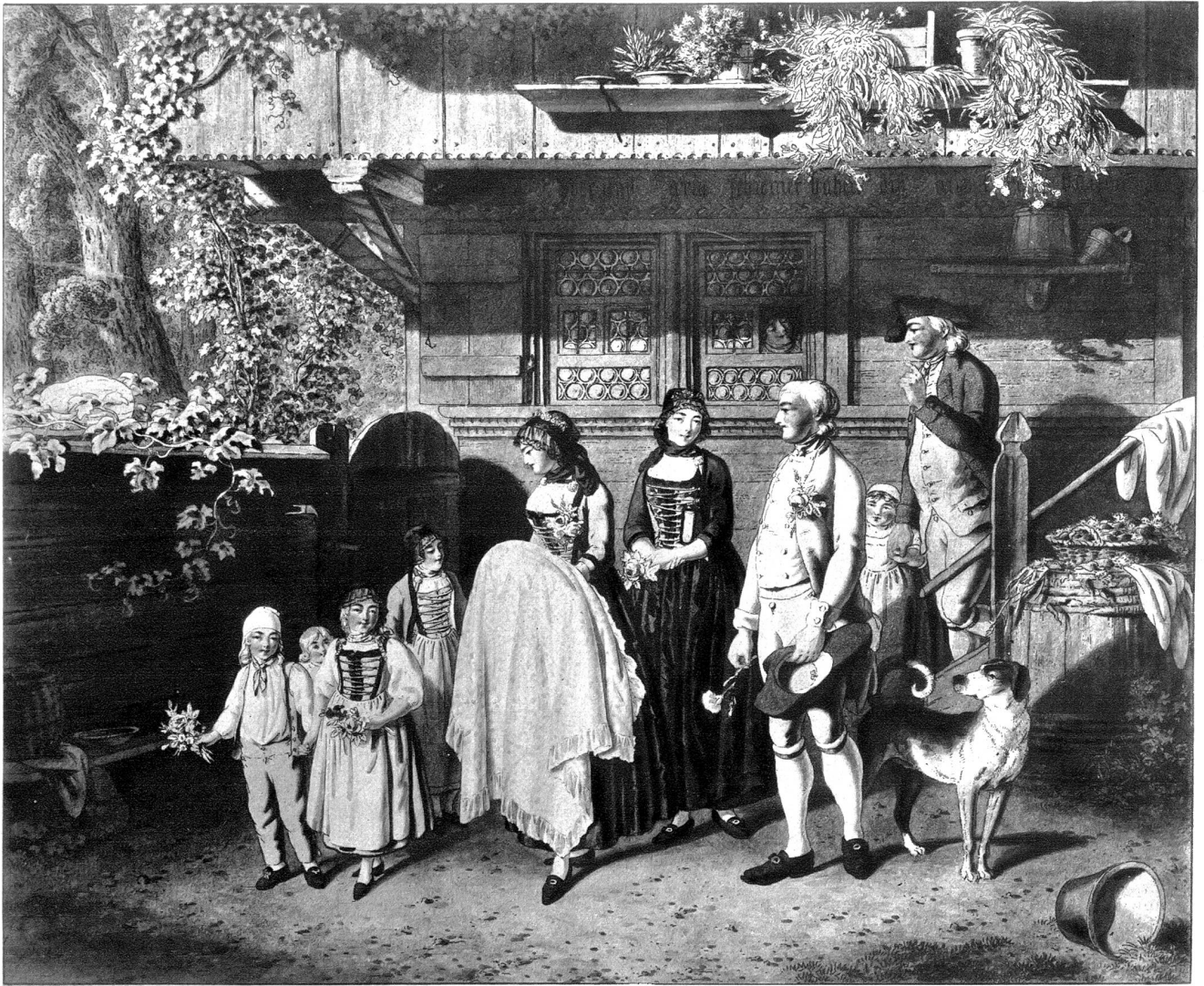
Fr. Niklaus König. Die Kindstaufe im Kanton Bern. — Kunstmuseum Bern