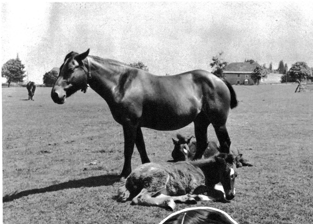
In den Freibergen. Saignelégier

wogende Aehrenfelder fehlen fast ganz. In den Jurawäldern wohnt andächtige Stille. In ihrem Duster lebt das Märchen und das Geheimnis. Die Tannennadeln und die Moose weben weiche Teppiche zwischen die Stämme, und die Farne wuchern wirr umher, und manche seltsame Blume gedeiht in ihrer Einsamkeit. Die blauen und gelben Helme des Eisenhuts findet man da und die schöne Türkenbundlilie, der schöne Frauenschuh, diese beinahe ausgestorbene Orchidee.