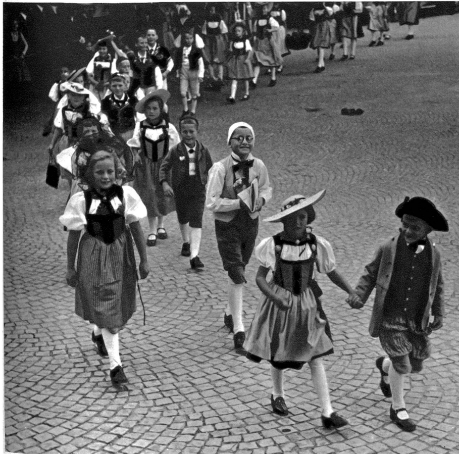
Besonders reizvolle Kindergruppe aus dem Festzug des Bernischen Kantonschützenfestes in Langnau