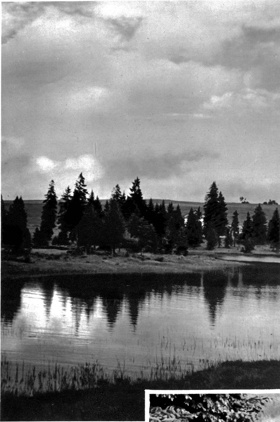
Die Weiler „Les Etanges de la Gruyère bei Saignelégier

irgendeinem abgelegenen Hof erinnert den Wanderer an den Heimweg.