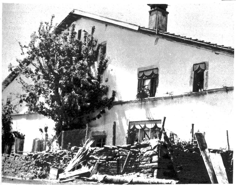
Typisches Jurahaus in den Freibergen

dem Meer der Blüten und dem Grün der Weiden ragen In- seln dunkler, ernster Wälder: manche gleichen in der Abendver- lorenheit fremdartigen Zypressenhainen. Eindrücken und Weiler und Dörfchen liegen mannigfach eingestreut, mit dunklen Dächern und hellen Kirchtürmen, oft in eine Talsenke geschmiegt, oft trugig auf Höhenrücken gebaut. Graue Straßenbänder durch- furchen das Grün der Bergwellen — bergauf, bergab, irgendwo