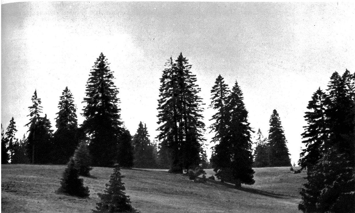
Jura-Weide „Paturage“ genannt