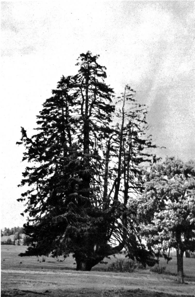
Wettertanne im Jura

im Lande sich verlierend. Eschen, Erlen und Ahorne wandern den Straßen entlang mit über Berg und Tal, Tannenriesen schauen von den Höhen weit in die Lande hinein, hier und da stehen, zu kleinen Gruppen vereint, jahrhundertalte Eichen.