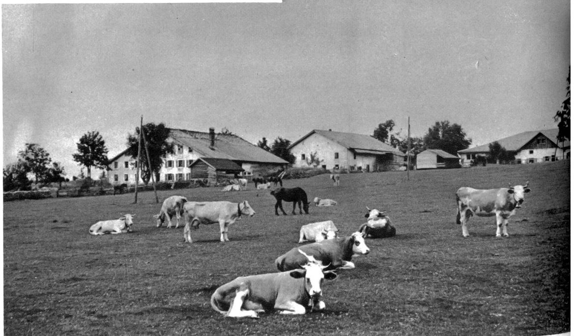
Bei Cerlatez in den Freibergen