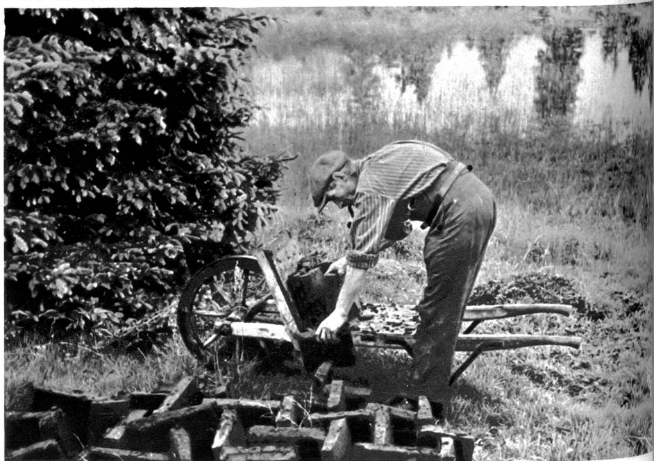
Die Torfausbeute bei Cerlatez

des bleiches Segel als Zerrbild auf dem windgekräuselten Wasser.