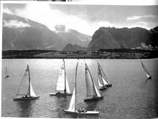
Segelregatta auf dem Thunersee. Spannender Kampf der 30m 2 Yachten