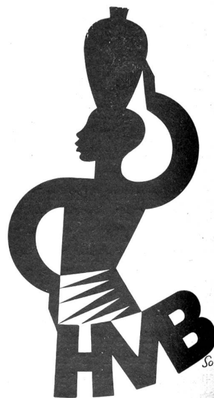
Markenzeichen H. Sollberger, Bern