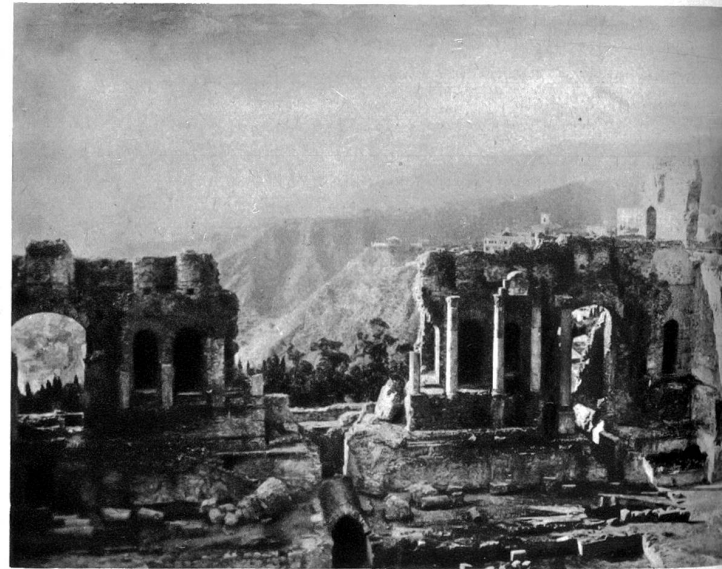
Blick vom griechischen Theater auf den Aetna