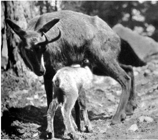
Gemse mit Jungen

zu unterstützen. Gelegenheit dazu wird sich bald genug bieten; man denke nur an die innere Einrichtung und planmäßige Erweiterung der Gems- und Steinbockgehege.