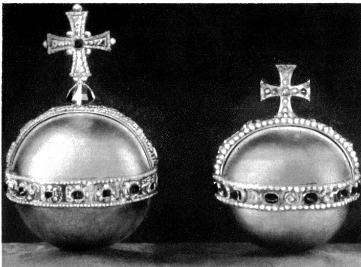
Der Reichsapfel des Königs und der Königin