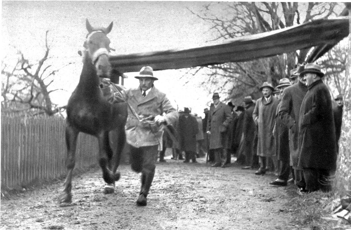
Hier wird ein zweijähriges Jurapferd der Vermittlungskommission vorgeführt