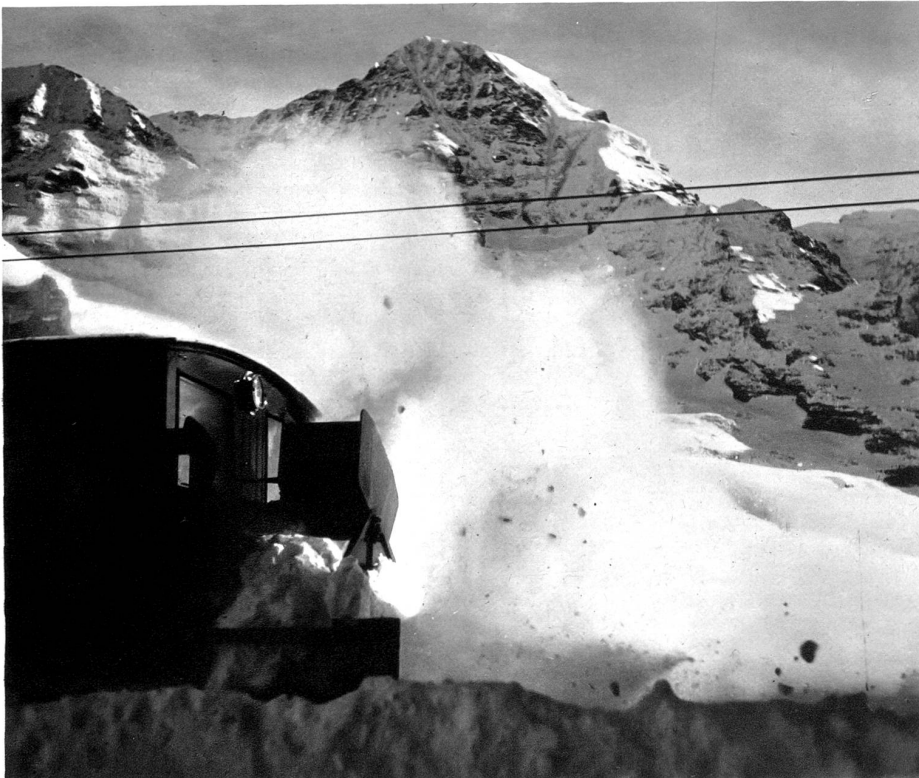
Schneesleudermaschine der Jungfraubahn. Im Hintergrund der Mönch

ganzen Länge nach durchgebogen; so entsteht die elastische Federung des späteren Ski. Nach Längen sortiert wandert das Holz nun für etwa acht Monate in das Luftlager, so daß es sich ziehen und dehnen kann. Als Abschluß dieses Prozesses wird die Latte ungefähr zwei Monate in den Trockneraum gelegt, wo sie bei 25 bis 30° C das Krümmwerden vollends verlernen soll; nachdem das trockene Holz noch einmal beschnitten worden ist folgt die Schlusstrocknung von vier bis sechs Wochen. Holz, das diesen sorgfältigen Prozeß durchgemacht hat, gibt bestimmt Ski ab, die sich nicht ziehen. Jetzt erst sind die immer noch überdimensionierten Rohlatten reif für die Fabrikation. Zuerst wird die Latte nun zur Maschinenform egalisiert, dann folgt sogleich die Spitzenbiegung; zu diesem Zwecke werden die aufgeweichten Spitzen in einen Formapparat eingespannt. Was nun als Abschluß folgt, ist mehr oder weniger Gefühlsache. Zuerst wird der Ski kontrolliert; die Federung muß elastisch sein, die Spitze korrekt