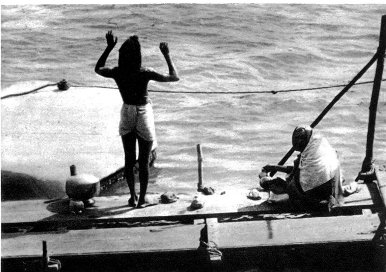
Gläubige Inder beten am Ganges

Mann mit sonnenbranntem Gesichte — der echte Sohn der Berge.