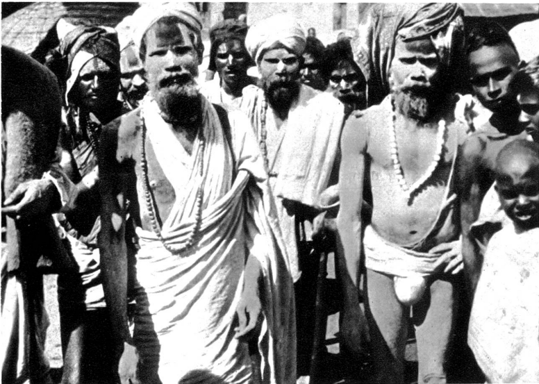
Sadhus, heilige Bettelmönche